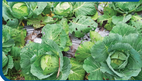
Kubis yang tidak menggunakan Cimegra